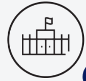
Note attribuée aux conditions d'accueil / 10