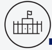
Note attribuée aux conditions d'accueil / 10