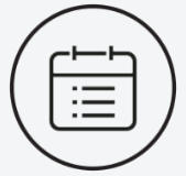
Satisfaction de la prise de rendez-vous