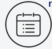
Note attribuée à la prise de rendez-vous / 10