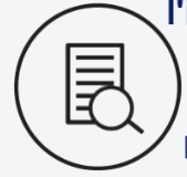
Note attribuée à l'accès de l'information / 10