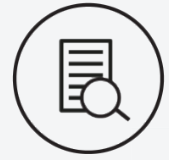
Satisfaction de l'accès à l'information