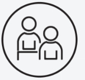
Satisfaction de la qualité de l'accueil