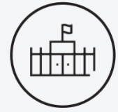
Satisfaction des conditions d'accueil