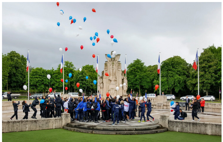
Challenge Michelet 2017, devant le monument aux morts

Lors de son discours d'investiture, il déclara « je serai toujours du côté de ceux qui ont les menottes ». Ayant vécu l'incarcération, il était très sensible aux problèmes des mineurs détenus et des jeunes en difficulté.