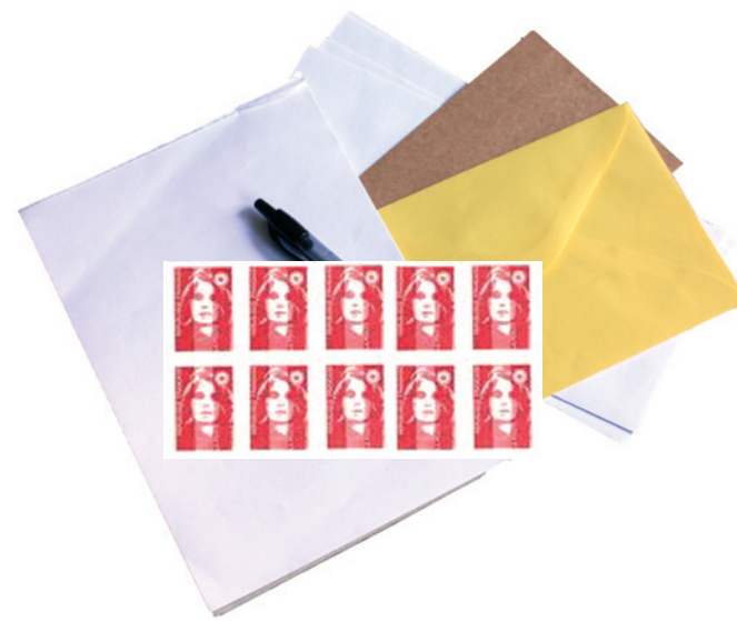
Nécessaire de courrier

Emballer les aliments dans des boîtes en plastique transparent ou des sachets plastiques (type sachets de congélation) fermés avec des élastiques ou des liens sans métal