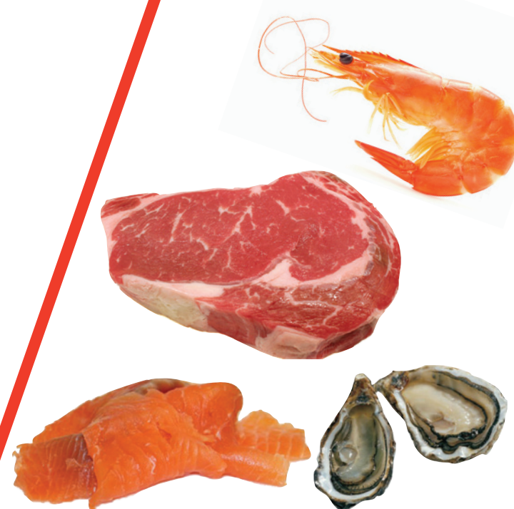
Produits dont la conservation est délicate