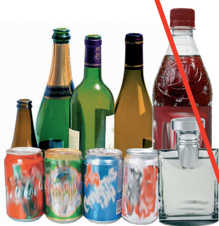
L'alcool (y compris dans les plats cuisinés) et tous les liquides (y compris les eaux de toilette)