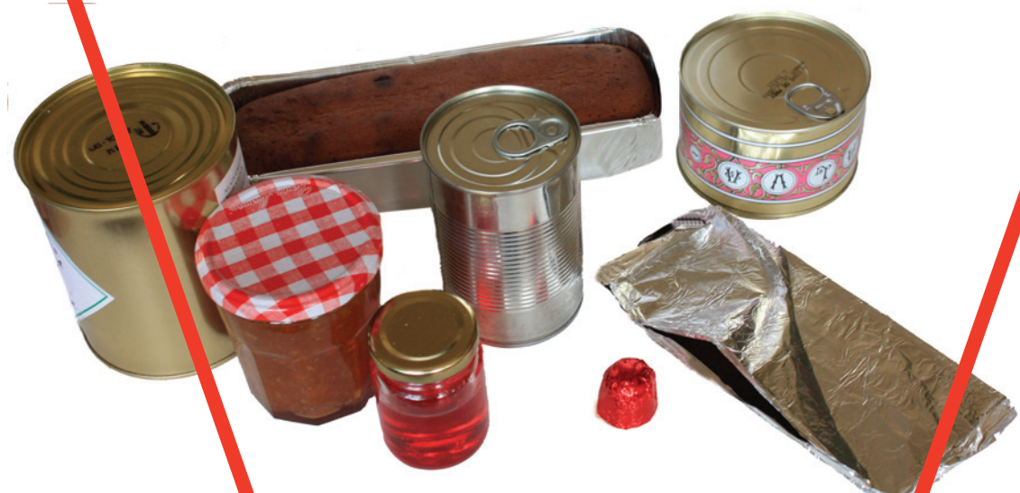
Emballages en aluminium, liens métalliques, récipients en métal, bocaux en verre