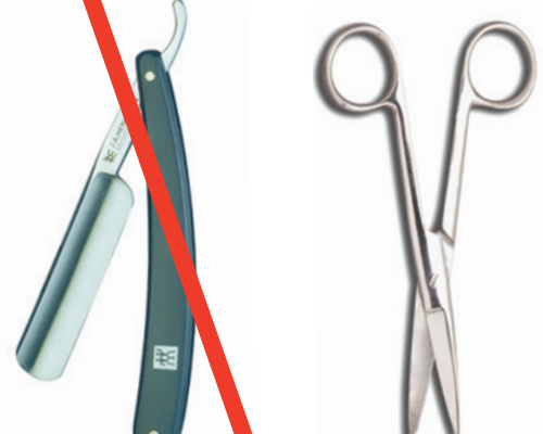
Armes, objets tranchants ou coupants