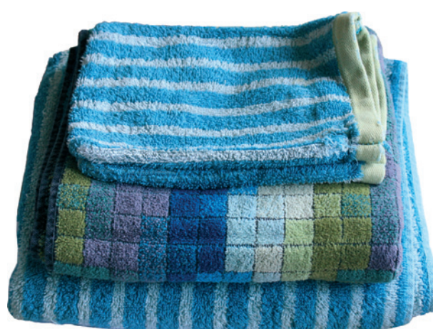
Linge de toilette