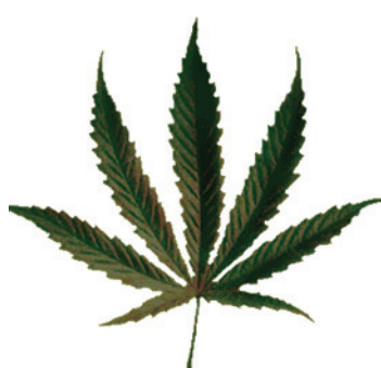
Médicaments, seringues, stupéfiants, tabac