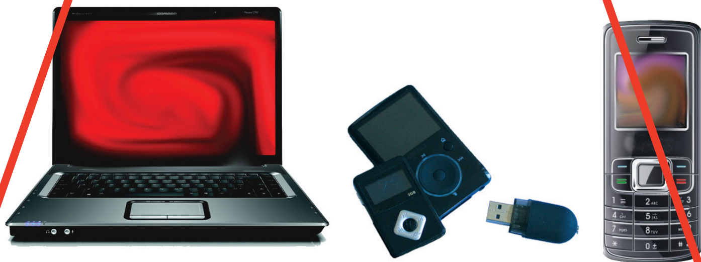
Téléphones portables, matériel informatique : ordinateur, clé USB, MP3, clé 3G, etc.

Le poids total du colis (transmis en 1 ou, sur autorisation exceptionnelle du chef d'établissement, 2 paquets) ne doit pas dépasser 5 kg.