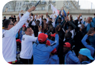
P. 3 : Les interviews et les rencontres du jour