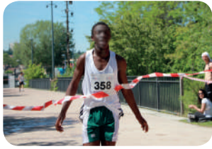
P. 2 : Retour sur les épreuves d'hier