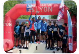
P. 4 : Les résultats