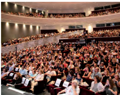
© L'Action Sociale - Assises 2018

Selon vos possibilités : venez à Nantes pour plus de rencontres et de convivialité ou suivez les Assises sur notre plateforme dédiée (application imagina) avec des live de qualité et de l'interactivité.