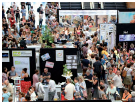
© L'Action Sociale - Assises 2018